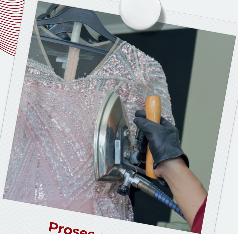
Proses setrika oleh tim presser