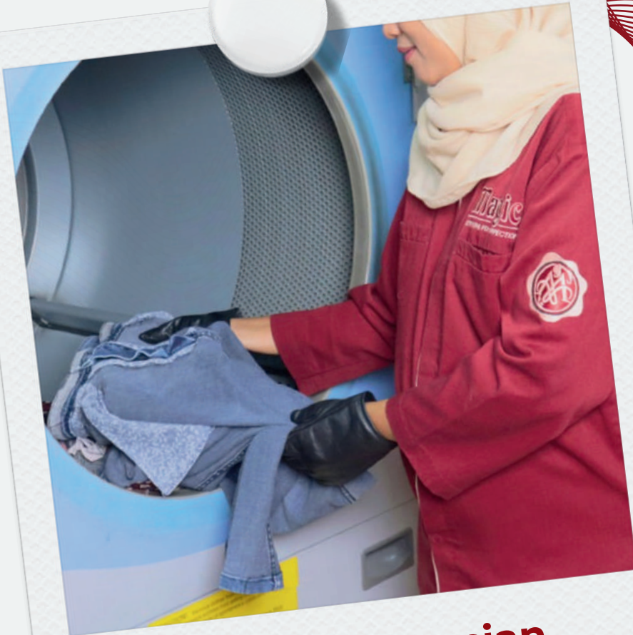
Proses pencucian oleh tim washer