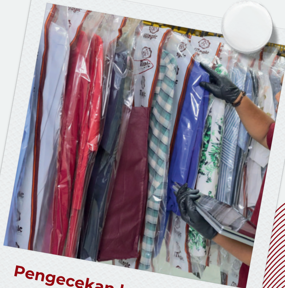
Pengecekan kelengkapan cucian oleh Quality Checker